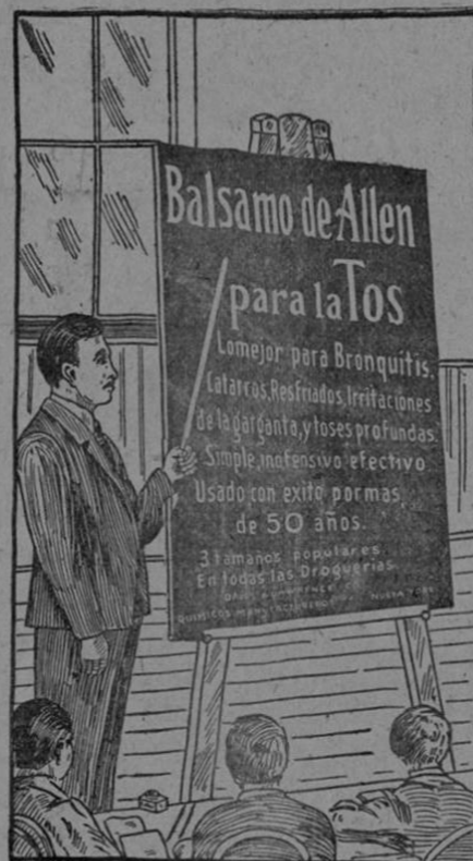
Balsamo de Allen para la Tos. Mejor para Bronquitis, Catarras, Resfriados, Irritaciones de la Garganta y Toses profundas. Simple y mansueto, efectivo. Usado con éxito por más de 50 años.

Nota De Los Fabricantes. El Hierro Nuxado que se prescribe y recomienda en las líneas anteriores por los médicos, no es un remedio secreto, sino que por el contrario es bien conocido por los farmacéuticos de todo el mundo. Es completamente distinto de los antiguos productos del hierro inorgánico, pues es fácilmente asimilado y no perjudica la dentadura ni empuja los dientes, ni trastorna el estómago. Los fabricantes garantizan que los resultados son buenos y enteramente satisfactorios para todos los compradores o de lo contrario les devolverán su dinero. De venta en todas las buenas Droguerías.